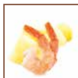
Vellutata di gamberetti e patate