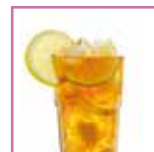
The al limone