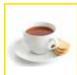
Colazione the e biscotti