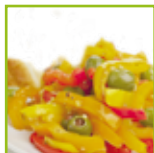
Peperonata con patate