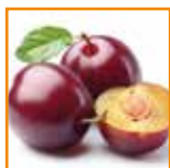
Mousse di prugna e mela