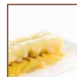
Vellutata polenta e formaggi