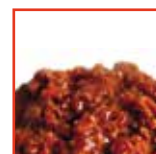
Crema al ragù