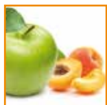
Mousse di mela e albicocca