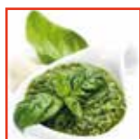
Crema al pesto