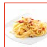
Crema alla carbonara