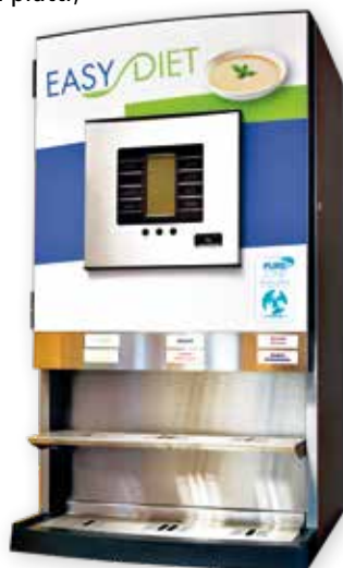
Sistema di erogazione Easy Diet