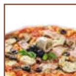
Vellutata alla pizza capricciosa