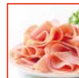
Crema al prosciutto cotto