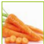
Contorno di carote