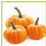
Contorno di zucca