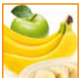
Mousse di mela e banana