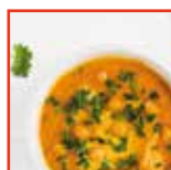
Crema di ceci