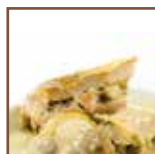
Vellutata baccalà alla vicentina