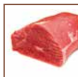
Vellutata di manzo