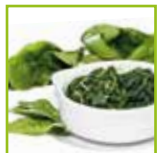
Contorno di spinaci