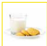
Colazione latte e biscotti