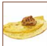
Vellutata frittata di cipolle