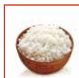
Crema di riso