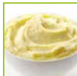
Contorno purè di patate