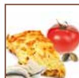
Vellutata frittata pomodoro capperi e acciughe