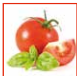
Crema pomodoro e basilico