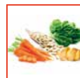
Crema di verdure