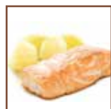
Vellutata al salmone