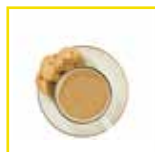
Colazione latte, caffè, biscotti