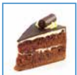
Torta al cioccolato