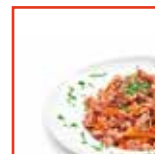
Crema di pasta al tonno