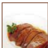
Vellutata al brasato di manzo