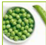
Contorno di piselli