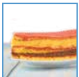
Torta zuppa inglese