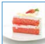
Torta alle fragole