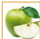
Mousse di mela