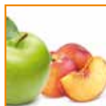
Mousse di mela e pesca