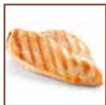
Vellutata di pollo